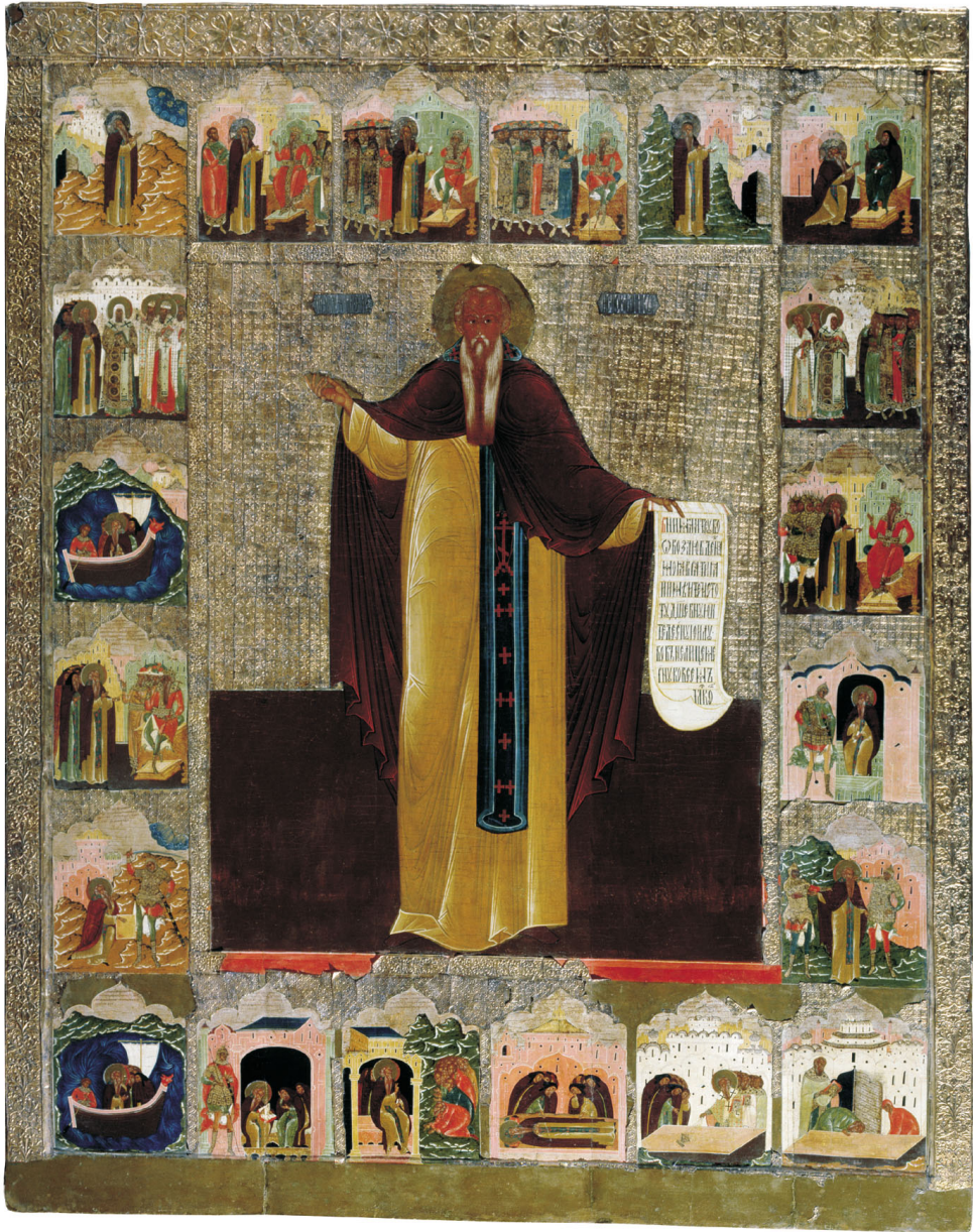
Όσιος Μάξιμος ο Ομολογητής και ο βίος του (Istoma Gordeev, Μουσείο Τέχνης και Ιστορίας του Solvychevodsk, Ρωσία)