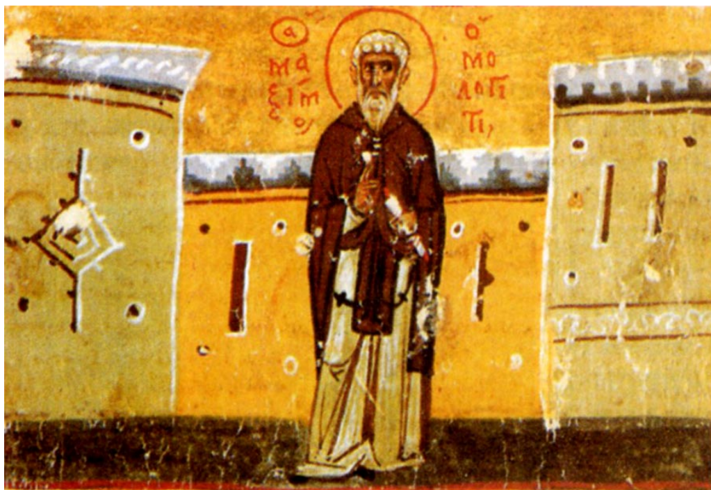
Όσιος Μάξιμος ο Ομολογητής (Bibliothèque Nationale de France, Paris, Ms. grec 1561, fol. 87a)