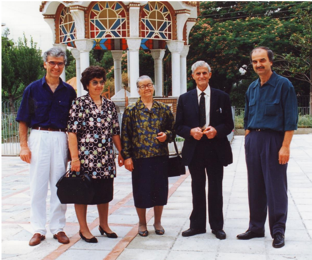
Οι Οικογένεια στα ευτυχισμένα χρόνια.

Γρήγορα ήρθαν τα γεράματα, ούτε που το κατάλαβαν πότε πέρασαν τα χρόνια. <<Σαν χθες ήταν τα παιδιά μας μικρά βρε γυναίκα θυμάσαι; Θυμάσαι κάθε φορά στη γιορτή μου, που ανοίγαμε όλες τις πόρτες, και έτρεχαν τα παιδιά από το πρώτο δωμάτιο μέχρι το τελευταίο; Φωνάζοντας όπως κάνει το μούτρίς*>>; Στο σπίτι είχαν προστεθεί ακόμα δύο δωμάτια στη σειρά, που χρησιμοποιούνταν το ένα για κουζίνα και το άλλο για αποθήκη και μπάνιο. Έτσι πράγματι έμοιαζε σαν τρένο.