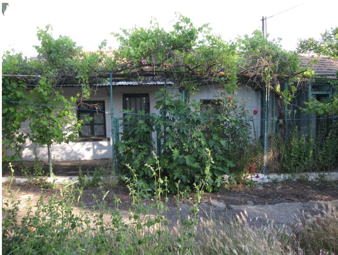
Το σπίτι στο Πεδινό.