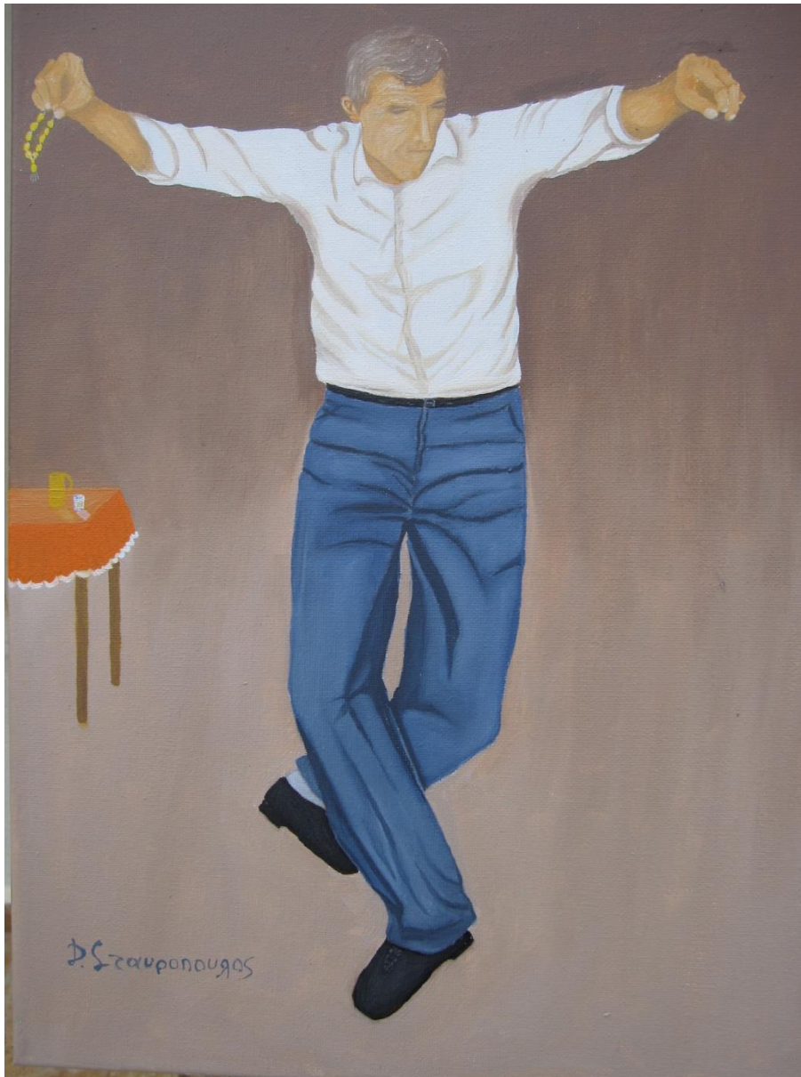
Πίνακας σε καμβά με λάδι από τον Δημήτρη Σταυρόπουλο.