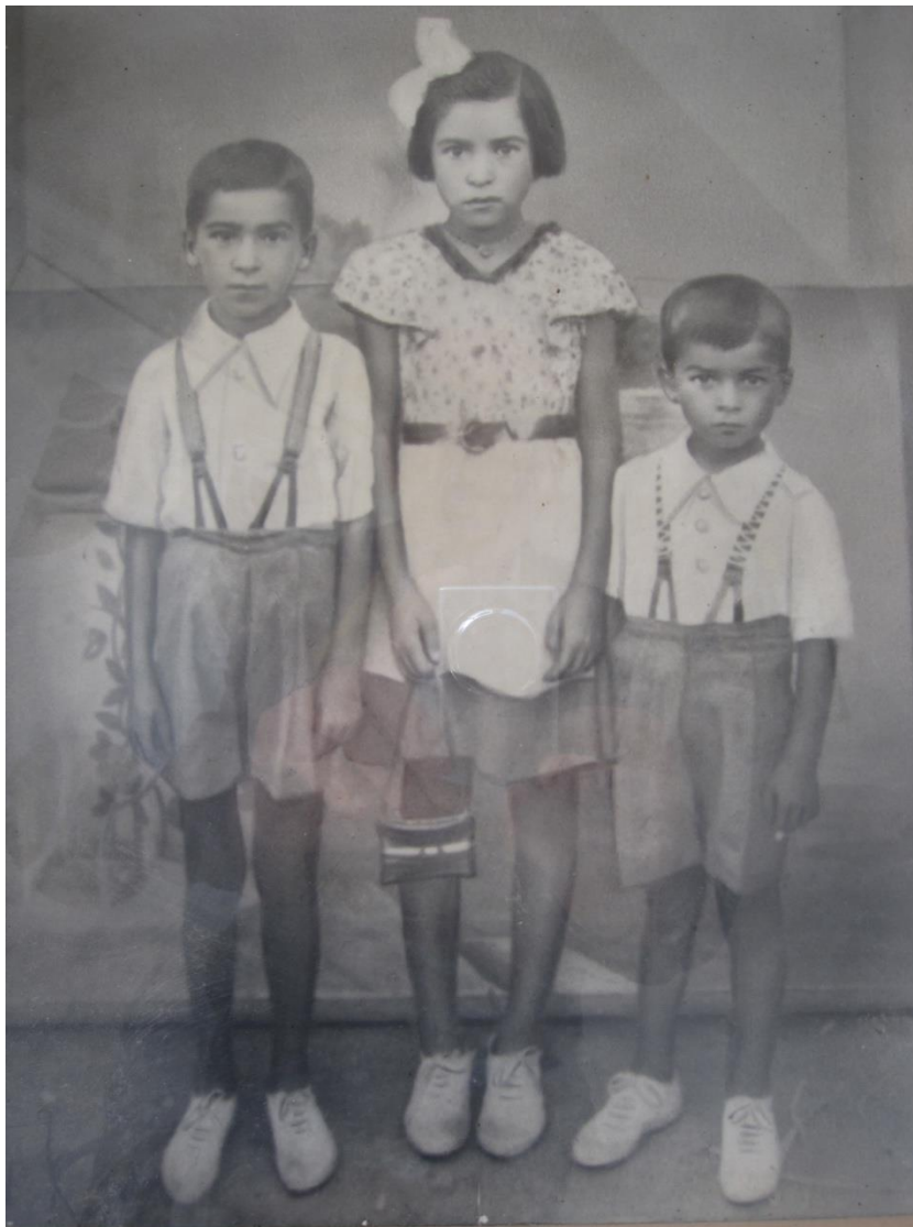
Τα τρία αδέρφια, με γόνατα χοντρότερα απ τα μπούτια τους.