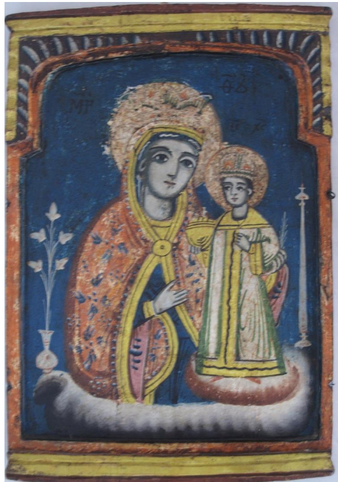
Εικόνα από τη πατρίδα.

Πεθερά και νύφη τα πήγαιναν πολύ καλά, μαζί σε όλες τις δουλειές μέσα και έξω από το σπίτι. Το σπίτι μέσα δεν είχε τίποτα ήταν σχεδόν γυμνό. Ούτε πινακοτομέσαλα* είχαν που τα χρειάστηκε την πρώτη κιόλας μέρα με το ζύμωμα του ψωμιού.