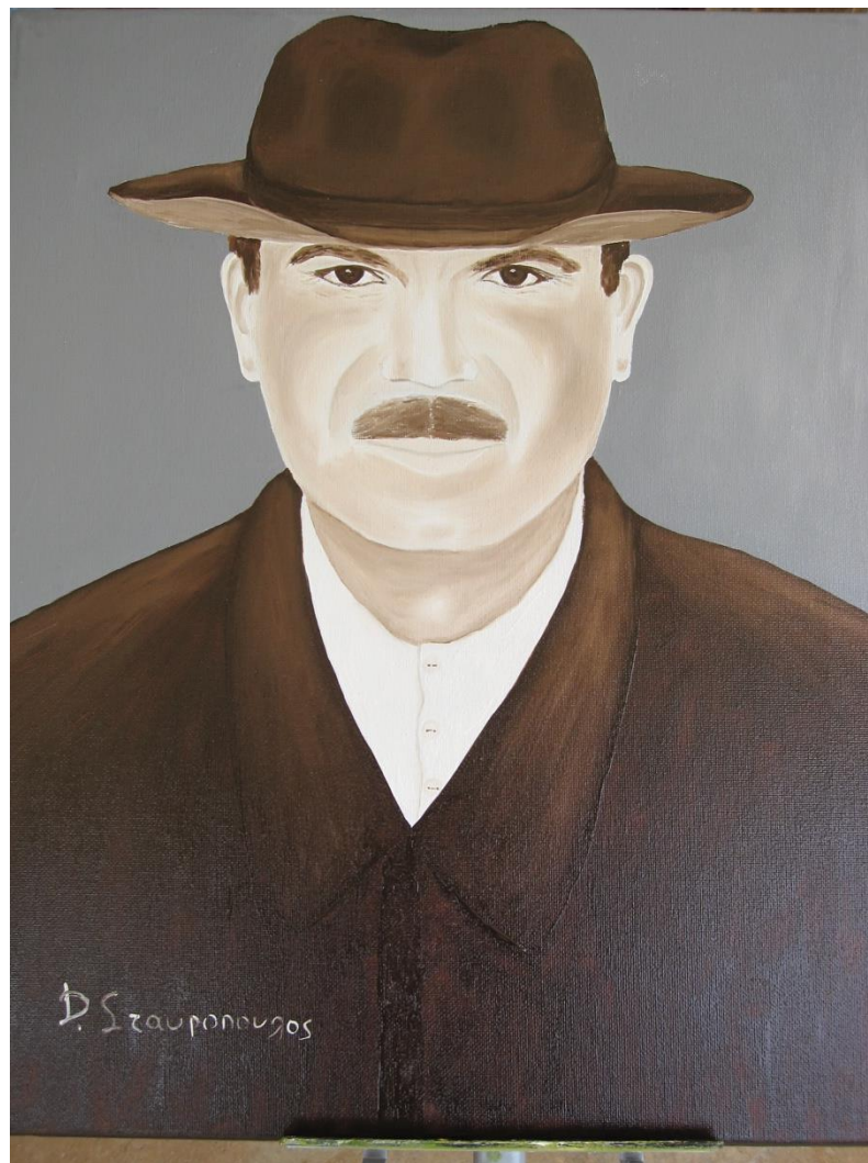
Ο Δημήτρης (Πίνακας σε καμβά με λάδι από τον Τάκη.

Ποτέ δεν έμαθε που βρίσκονταν τ' αδέρφια του. Μετά από χρόνια βρέθηκαν, ο Χρυσομάλλης στο Περιστέρι του νομού Κιλκίς, ένας στο Κοπανό Ημαθίας, ένας άλλος στην Ιωνία του Βόλου και δύο αδερφές στη Ρουμανία.